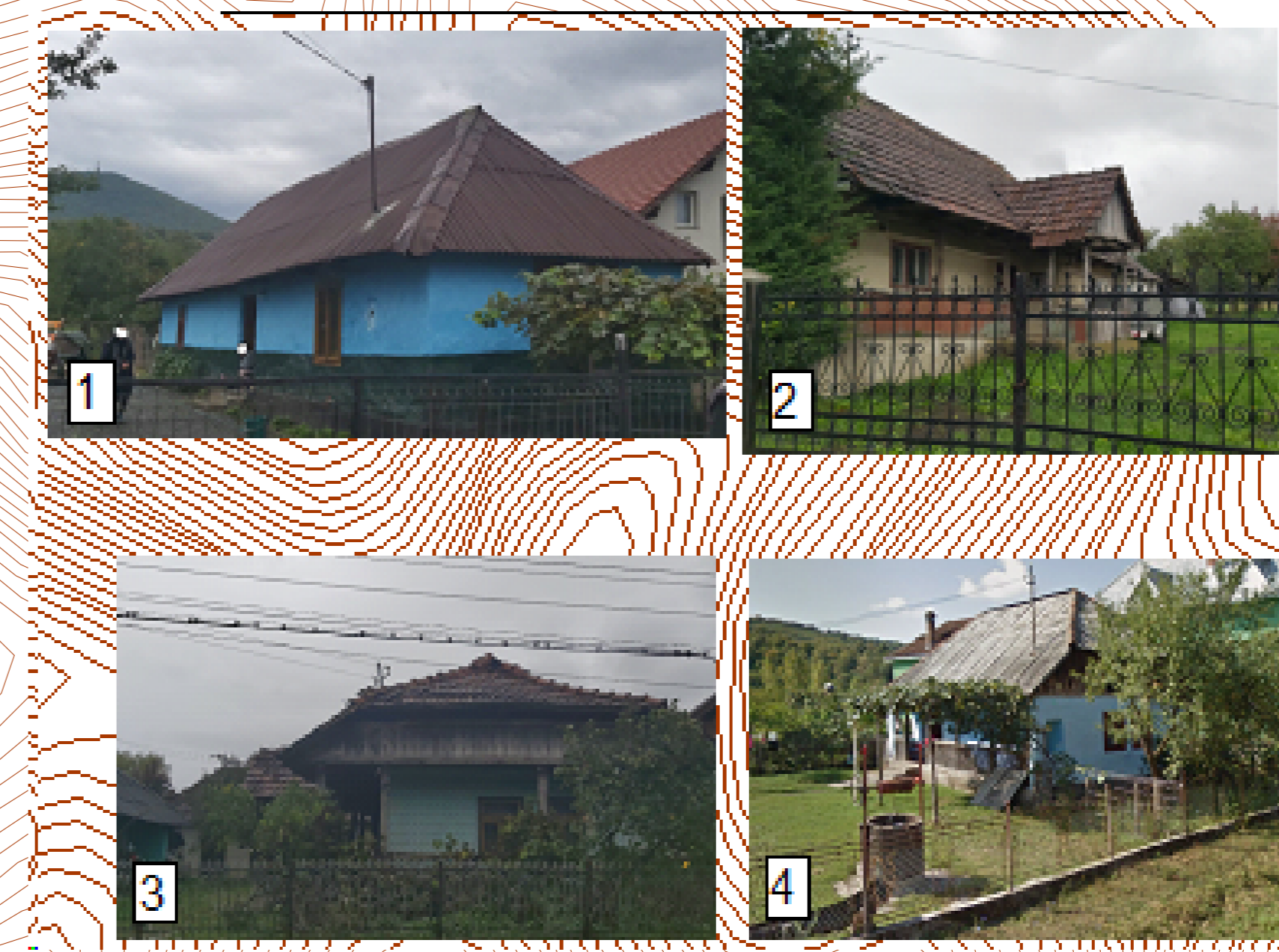
CONSTRUCȚII CU ARHITECTURĂ TRADIȚIONALĂ